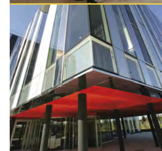
Au Carré ou à Bois Sénart, les grands projets novateurs trouvent à Sénart une terre d'élection.